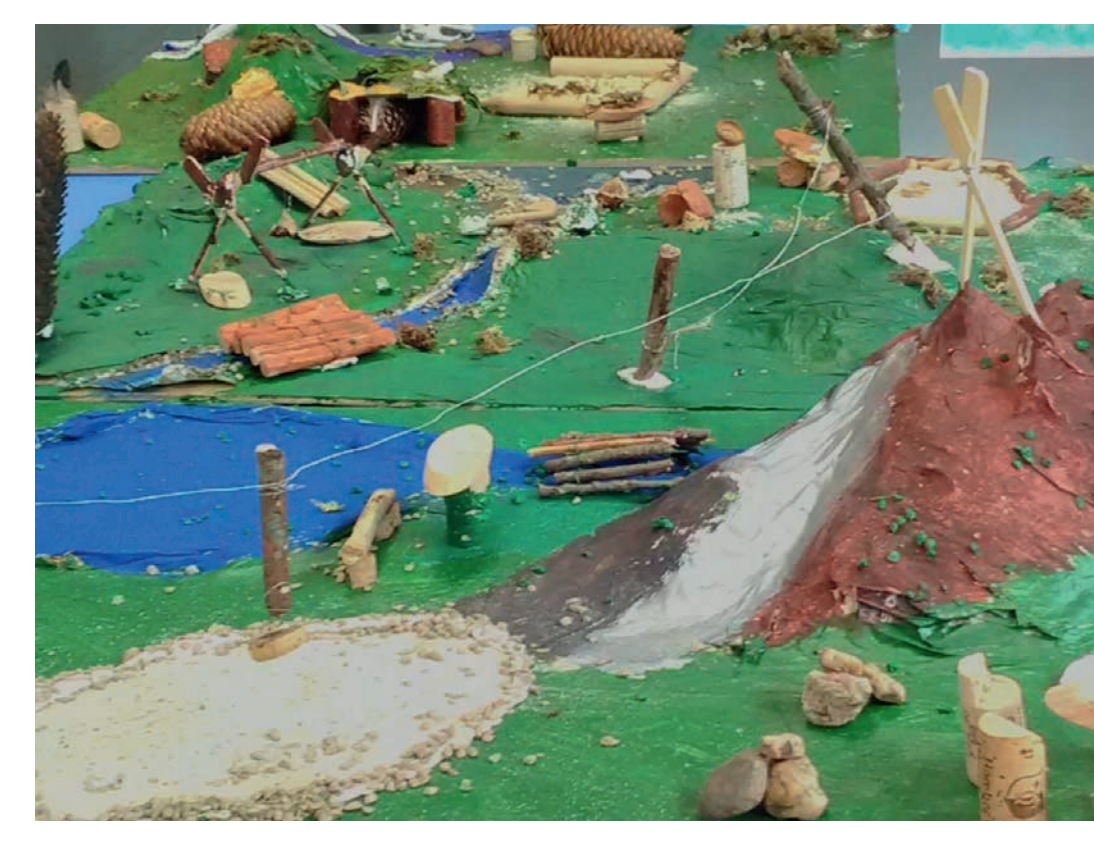
Kunstwerk der Kinder zum Thema Natur-Erlebnisraum, foto credits: KRAKE Family Community

De kinderen van Kranenburg wensen zich een natuurspeel-tuin voor hun dorp. Op basis van deze wens heeft zich een actiegroep uit families, leraren en andere professionals gevormd, die de omvorming van het schoolplein tot een natuur-belevenis-ruimte verwezenlijkt.