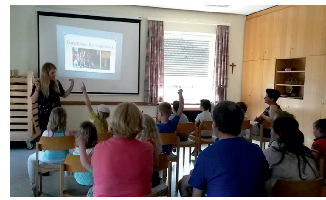
Ergebnispäsentation an die Kinder

De kinderen van Nütterden hebben gezamenlijk overlegd en bediscussieerd, welke plekken ze in hun dorp leuk vinden, wat ze graag daar doen en wat ze zich nog meer voor het dorp wensen. Op basis van de uitkomsten is het plan een plattegrond van Nütterden voor kinderen uit te werken.