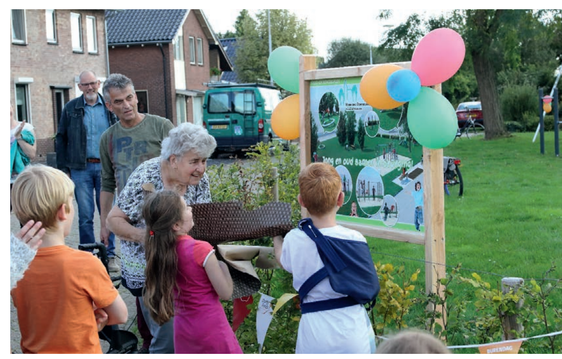
Varselder-Veldhunten, Foto credits: Nico Marcus

Wie denkt die Jugend über das Dorf? Wie knüpfen wir an ihre Bedürfnisse an? Im Oktober/November 2018 organisieren wir zwei Workshops. Im ersten Workshop werden Kinder und Jugendliche in Teams miteinander über unterschiedliche Themen im Dorf sprechen, zum Beispiel über den Verkehr und das Gemeindezentrum, aber auch über Spielmöglichkeiten und chillen. Zusammen werden sie entscheiden, bei welchem Thema noch Handlungsbedarf besteht. In einem zweiten Workshop werden sie davon träumen, was sich im Dorf verbessern kann und arbeiten zusammen einen Plan für das Dorf aus den sie präsentieren.