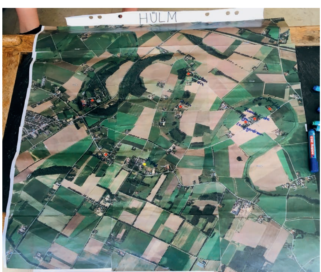
Orte für Kinder und Jugendliche in Hülm, Foto credits: KRAKE Family Community

Ondervraging door jongeren van kinderen en jongeren met betrekking tot wensen en ideeën voor een nieuw dorps-huis en voor het dorp in z'n geheel. Actieve inbreng van de ideeën door de jongeren in de gemeente en de dorpsvereniging.