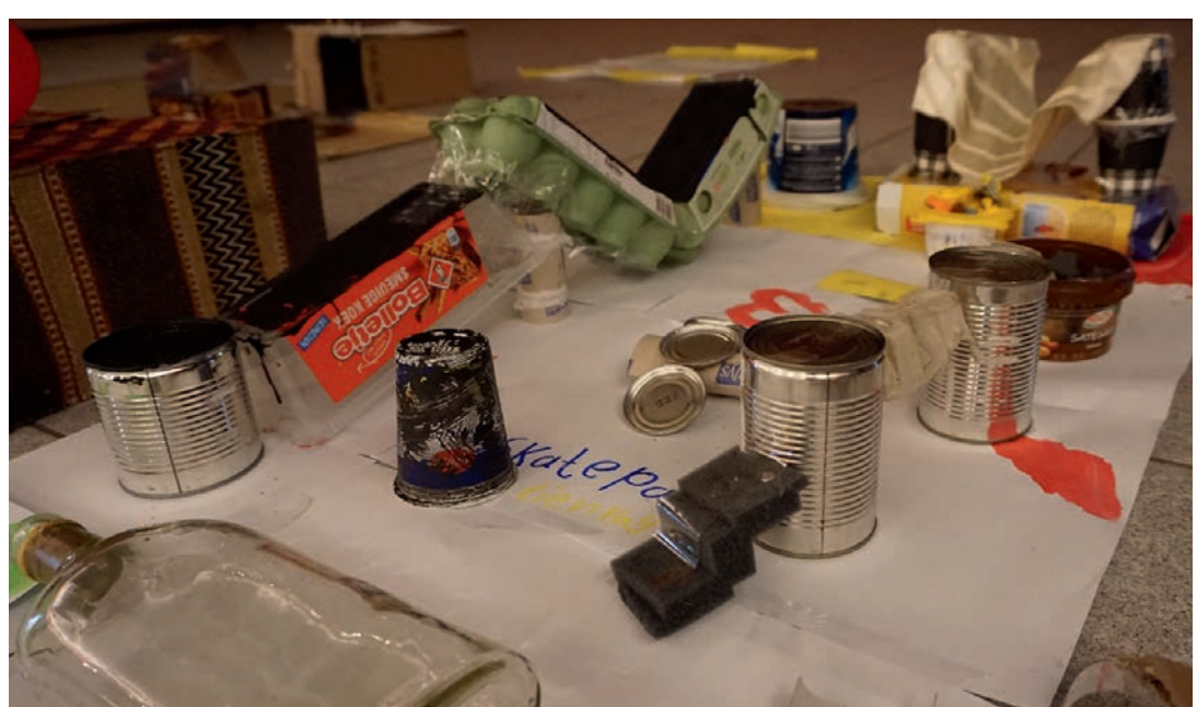
Tienray, foto credits: KRAKE Family Community

Wie ist es für die Jugend in Tienray zu wohnen? Was findet sie wichtig? Und wie involvieren wir sie in Gestaltungspläne? In einem Rap, mit Hilfe von Karten, Fotos und Zeichnungen äußerten sich Kinder darüber, was sie toll und weniger toll im Dorf finden. In einem zweiten Workshop träumten sie davon, wie es besser werden kann. Danach bedachten sie Pläne, die sie mit Karton oder anhand eines Filmes veranschaulichten. Eine der Ideen war ein Spielwald mit Wasserelementen. Dieser Plan wird nun durch das Dorf weiter ausgearbeitet.