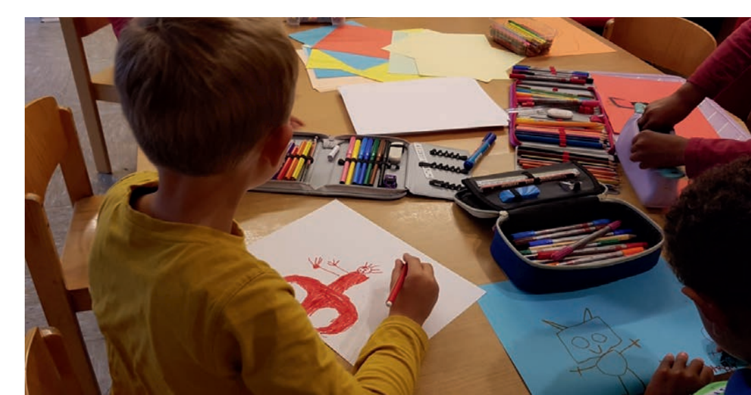
Workshop zum Thema Roboter

In Zyfflich hebben toekomstworkshops met de kinderen plaatsgevonden waarin ze beschreven, schilderden en knutselden, welke ideeën ze voor hun dorp hebben. De kinderen vonden het thema robots/mechanica het interessantst. Samen met hen is er een projectontwerp uitgewerkt en er zijn ideeën verzameld, welke activiteiten in het dorp realiseerbaar zijn. In samenwerking met de Hochschule Rhein-Waal is er een tweede workshop met 'echte robots' aan het einde van dit jaar gepland.